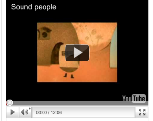
Ganador de la categoría Cortometraje Júnior Escuela Camera-etc de Liège, Bélgica