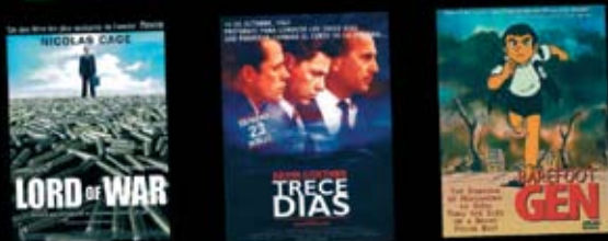
El senyor de la guerra

Aquesta activitat es posa a disposició dels ajuntaments de la província de Barcelona en el marc de l'Oferta d'accions de sensibilització de la Diputació de Barcelona